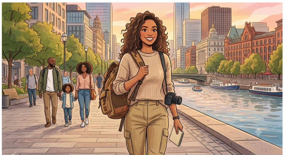
Imagem gerada por IA / Google Gemini

Hoje consigo pensar antes de agir, sinto minhas emoções.