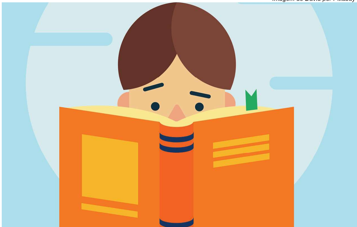
Imagem de David por Pixabay

Q uando entrei na escola, já estava alfabetizada e sabia o básico da aritmética - minha mãe havia me ensinado. Mesmo assim, iniciei na sala da primeira série; poucos dias depois mudei para a segunda e precisei fazer uma prova para deixar documentada essa "promoção" por conhecimento.